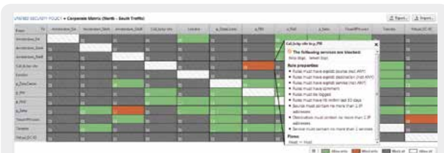
La matrice della policy di sicurezza unificata Tufin: definire e applicare il quadro di sicurezza tra reti ibride

Tufin Orchestration Suite e Cisco ACI permettono ai responsabili della sicurezza di applicare e gestire una policy di sicurezza unificata tra la propria infrastruttura on-premise e il cloud ibrido. Tufin gestisce tutte le modifiche legate alle policy di sicurezza nell'ambito di un processo di modifica documentato e verificabile con sicurezza intrinseca e controlli di conformità. Grazie a un percorso di verifica completo per tutte le modifiche, Tufin Orchestration Suite garantisce inoltre la conformità rispetto a standard normativi e interni. I clienti possono configurare notifiche e report per identificare e risolvere immediatamente le violazioni, riducendo il tempo e gli sforzi per raggiungere la disponibilità alle verifiche.